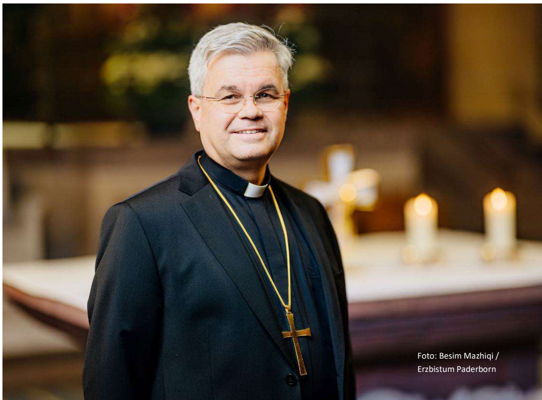
Erzbischof Dr. Udo Markus Bentz

Und dann möchte der neue Erzbischof sehr bald alle 19 Dekanate im Erzbistum Paderborn besuchen - und er wird beginnen: Bei uns im Dekanat Waldeck! Schon jetzt möchte ich herzlich zur Begegnung mit Erzbischof Dr. Bentz am 30. April einladen. Am Vormittag des beginnen wir mit einer Hl. Messe um 9.30 Uhr in Bad Wildungen und anschließenden Begegnungen dort. Von 13.30 bis 14.30 Uhr kann jede und jeder mit dem Bischof einen Spaziergang am Edersee machen, wir treffen uns an der Staumauer. Um 15.00 Uhr wollen wir mit ihm in St. Marien Korbach eine Andacht zu Ehren der Gottesmutter halten und uns anschließend im Haus der Gemeinde zum Kaffeetrinken und zur Begegnung treffen. Um 17.00 Uhr reist er weiter nach Bad Arolsen, genießt nach der Vesper um 17.30 Uhr einen Gang durch die Große Allee und rund um das Residenzschloss. Zum abschließenden Grillen am Pfarrheim sind – wie zu allen Veranstaltungen des Tages - alle Interessierten aus dem Dekanat eingeladen. Wer mag, kann also einen ganzen Tag mit dem neuen Erzbischof verbringen.