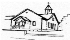
St. Peter und Paul Eppe St. Ursula Nieder-Schleidern